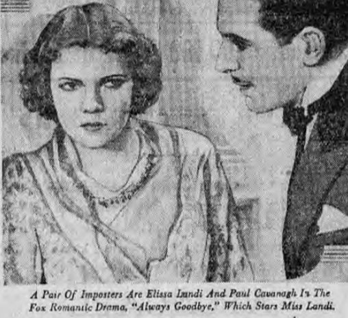
A Pair of Imposters Are Elisa Landi and Paul Cavanaugh in The Fox Romantic Drama, "Always Goodbye," Which Stars Miss Landi.